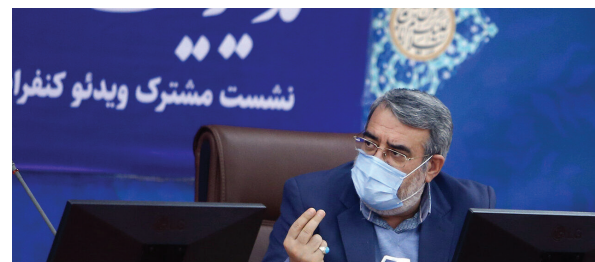
نشست مشترک ویدئو کنفرانس

با بیان اینکه عوامل ترور سردار سلیمانی باید بدانند انتقام این شهید گرفته خواهد شد، گفت: قدرت های فرامنطقه ای به گزارش خبرگزاری مهر به نقل از روابط عمومی وزارت دفاع؛ امیر سرتیپ «امیر حاتمی» وزیر دفاع و پشتیبانی نیروهای مسلح در مراسم گرامیداشت سالگرد شهید حاج قاسم سلیمانی که در دانشگاه افسری و تربیت پاسداری امام حسین برگزار شد، با اشاره به اینکه شما جوانان حزب الهی در این دانشگاه جمع شده اید تا کار آموخته شوید و بتوانید مقدرات کشور را در دست بگیرید. اظهار داشت: شهید سلیمانی ابعاد متعددی دارد که در این روزها درباره آنها سخن های متعددی عنوان شده البته علی رغم همه این سخن ها باز هم کم است؛ اما یکی از ابعاد شهید سلیمانی که کمتر درباره آن مطالبی بیان شده، مدیریت راهبردی این شهید سرافراز است. وی افزود: امروز بدون تردید موقعیت کشورمان در طول چند دهه گذشته