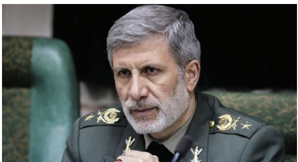
بی سابقه است: موقعیتی که در دوران انقلاب اسلامی ایجاد شده بی نظیر و ممتاز است؛ بخشی از این موقعیت جغرافیایی است، موقعیتی که دشمنان را برای ایران بوجود آوردند اما باید بدانند این توطئه میسر نمی شود.

برسند اما حضور راهبردی ایران مانع تحقق خواسته های آنها شد. وی در همین زمینه افزود: نظام سلطه همه توانمندی های علمی، تسلیحاتی و مالی خود را برای حمایت از تروریست ها پای کار آوردند تا این منطقه بیکارچی را از دست بدهد و امنیت رژیم صهیونیستی تامین نشود اما علی رغم همه این تلاش ها سلاح های راهبردی ایران که توسط نیروهای مقاومت مورد استفاده قرار گرفت، مانع تحقق اهداف آنها شد. وزیر دفاع در ادامه عنوان کرد: سر فصل خاصی برای دنبال کردن ایده های شهید سلیمانی در مبارزه با تکفیری ها در وزارت دفاع ایجاد کردیم و در حال دنبال کردن آن هستیم. وی تاکید کرد: عوامل ترور سردار سلیمانی باید بدانند انتقام این شهید گرفته خواهد شد البته انتقام بزرگ خروج آمریکایی ها از منطقه است با این وجود عاملان و آمران به شهیدت رساندن سردار سلیمانی هم مجازات خواهند شد. منطقه شاهدیم که کشورهایی منافع خود را در تبعیت از قدرت های فرامنطقه ای دنبال می کنند. وی با بیان اینکه هزینه استقلال ایران، تحریم، شهادت، اسارت و جانبازی است، اضافه کرد: قدرت های فرامنطقه ای دنبال این هستند تا ایران اسلامی ضعیف و وابسته باقی بماند اما طی این سال ها نه تنها استقلال خود را حفظ کردیم بلکه قدرت خود را نیز افزایش دادیم. امیر حاتمی تصریح کرد: دشمنان گروه های تروریستی را در منطقه غرب آسیا بوجود آوردند تا به خواسته های خود