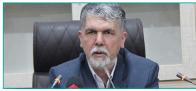
وزیر فرهنگ و ارشاد اسلامی : قدرت دوگانه قدسی و مدنی در مرجعیت شیعی کم‌مانند است