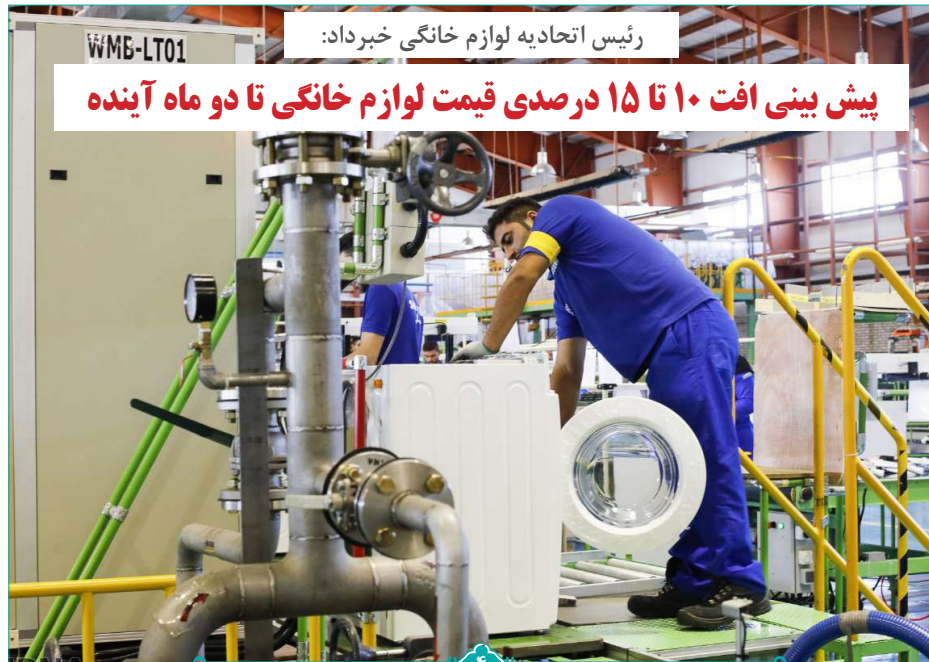
رئیس اتحادیه لوازم خانگی خبر داد:

منابع حاصل از حذف یارانه دهک‌های بالا از ماه اول وارد چرخه اقتصاد می‌شود