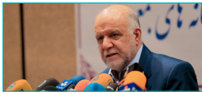
وزیر نفت عنوان کرد : از هر روشی برای صادرات نفت استفاده می‌کنیم