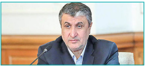
وزیر راه و شهرسازی : مسیرهای تردد زائران اربعین امن است