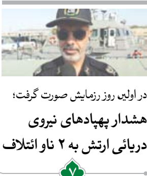
در اولین روز نمایش صوت گرفت؛ هشدار پهپادهای نیروی دریائی ارتش به ۲ ناو ائتلاف