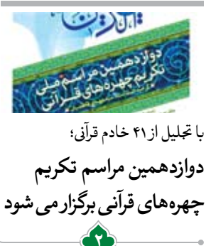
با تحلیل از ۴۱ خادم قرآنی؛ دوازدهمین مراسم تکریم چهره‌های قرآنی برگزار می‌شود