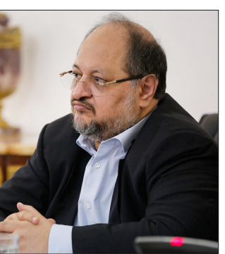
وزیر تعاون، کار و رفاه اجتماعی گفت: امروز الکترونیکی سازی خدمات اداری منافع بروز فساد را از بین می‌برد و قطع ارتباط حضوری از اولویت‌های مهم در این