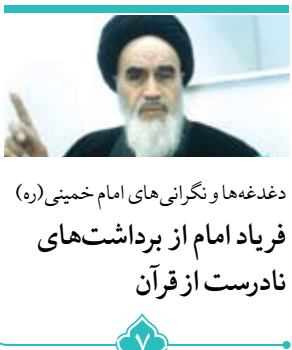
دغدغه‌ها و نگرانی‌های امام خمینی (ره) فریاد امام از برداشته‌های نادرست از قرآن