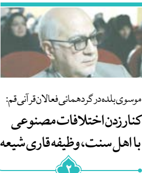
موسوی بلده در گردهمایی فعالان قرآنی قم: کنارزدن اختلافات مصنوعی با اهل سنت، وظیفه فاری شیعه

به مناسبت سالروز ورود به شهر مقدس قم؛ در گفت و گو با چهار شخصیت حوزوی بررسی شد دلیل اصرار علما برای زعامت آیت الله العظمی بروجردی (ره) صفحه ۴