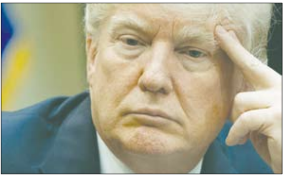
دونالد ترامپ، رئیس‌جمهور آمریکا، در جریان سخنرانی در کاخ سفید، ۲۰۲۰

این سیاستمدار عراقی گفت: رهبران جمهوری اسلامی از حکمت، تجربه و توان لازم برای ایستادن در برابر طرّحی که ترامپ قصد پیاده کردن آن در منطقه دارد، برخوردارند.